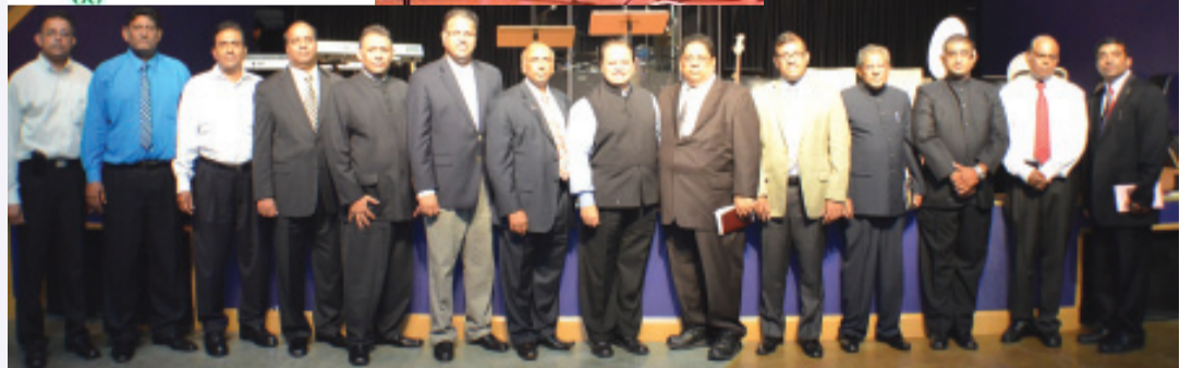
ഗസ്റ്റ് സ്പീക്കർസിനോടൊപ്പം ഭാരവാഹികൾ